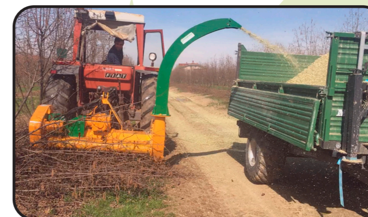
▶ Collo d'oca