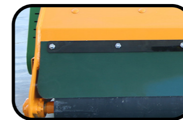
▶ Gomma posteriore