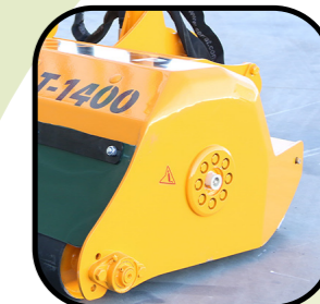
▶ Laterale arrotondato