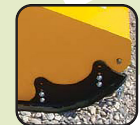
▶ Slitte anteriori