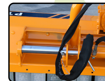
▶ Spostabile idraulico