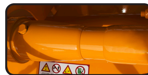
▶ Ruota libera nel manicotto