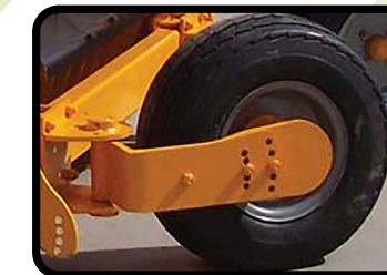
▶ Ruote posteriori