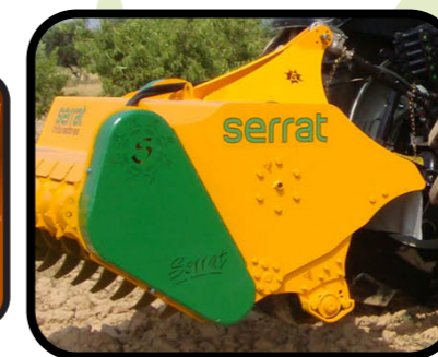
▶ Preparazione trepunte