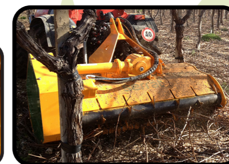
▶ Anteriore o posteriore