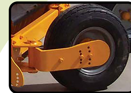
▶ Ruote posteriori