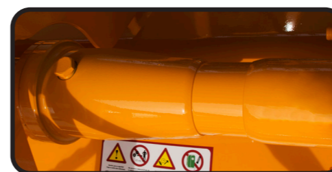
▶ Ruota libera nel manicotto