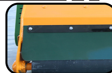
▶ Gomma posteriore