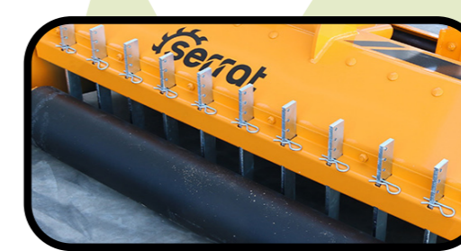
▶ Aste di raccolta