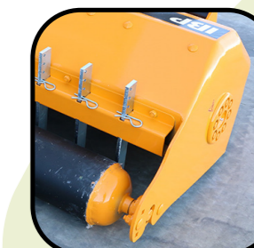
▶ Laterale arrotondato