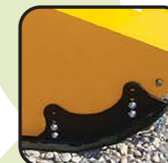
▶ Kit slitte anteriori solo con laterale dritto