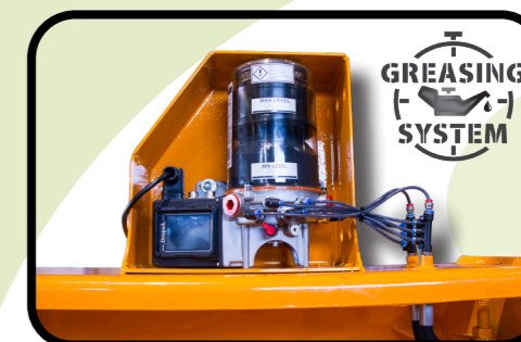
▶ Lubrificazione centralizzata