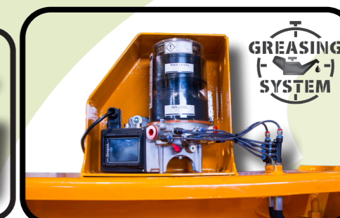
▶ Lubrificazione centralizzata