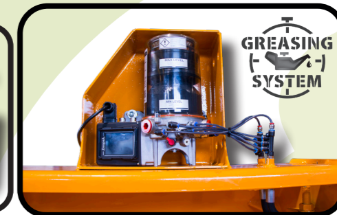
▶ Lubrificazione centralizzata