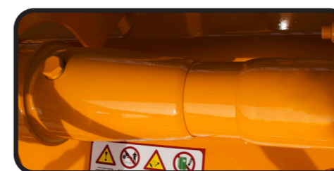
▶ Ruota libera nel manicotto