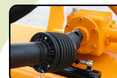
▶ Ruota libera nella trasmissione