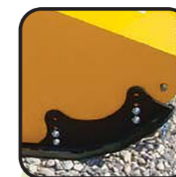
▶ Slitte anteriori