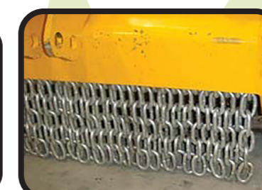
▶ Catene anteriori