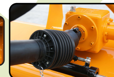
▶ Ruota libera nella trasmissione