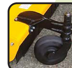
▶ Ruote anteriori