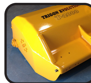
▶ Laterale curvo