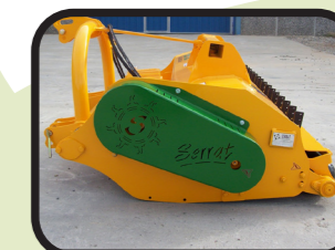
▶ Coperchio cinghie