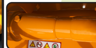
▶ Ruota libera nel manicotto