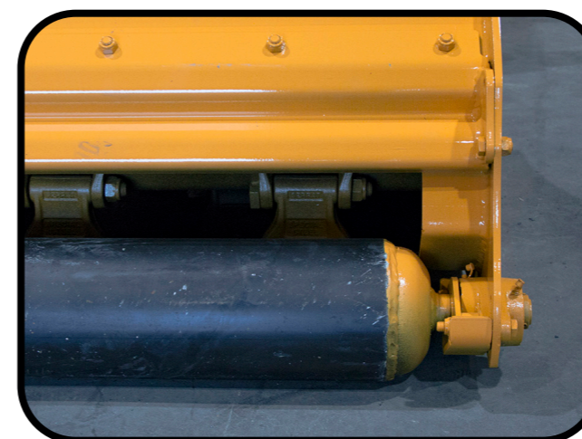
▶ Rullo posteriore di controllo del suolo